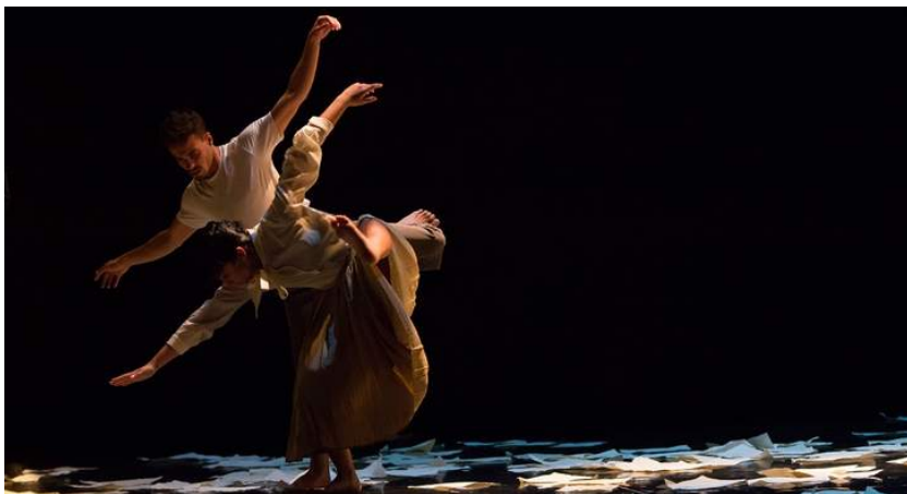
Quorum Ballet abre la Feria estrenando en España '30.000 vidas / Aristides'

Ocho de cada diez obras a escena suponen una novedad. 16 de ellas se verán por vez primera sobre las tablas de alguno de los 15 espacios escénicos de Ciudad Rodrigo